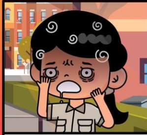
ผู้ที่พักผ่อนน้อย