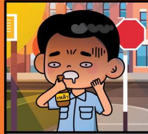
ผู้ที่ดื่มแอลกอฮอล์