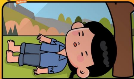
นำตัวผู้ป่วยเข้ามาในที่ร่ม