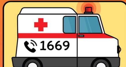
หากอาการไม่ดีขึ้น รีบส่งโรงพยาบาล