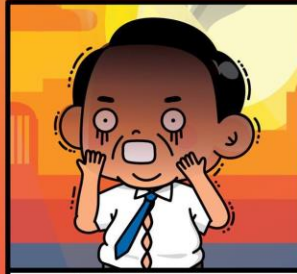
ผู้ป่วยเรื้อรัง(เบาหวาน/ความดัน)