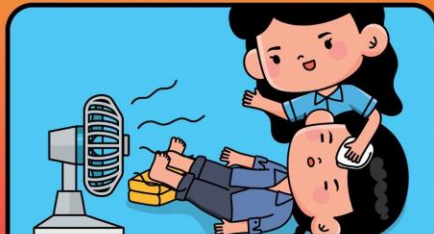
ใช้ผ้าชุบน้ำเย็นเช็ดตัวและศีรษะ ใช้พัดลมเป่าระบายความร้อน