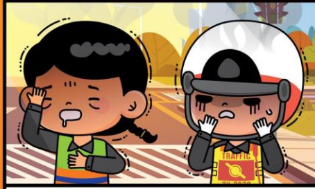
ผู้ที่ทำงาน/กิจกรรมกลางแจ้ง