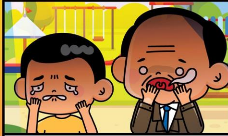
เด็ก/ผู้สูงอายุ